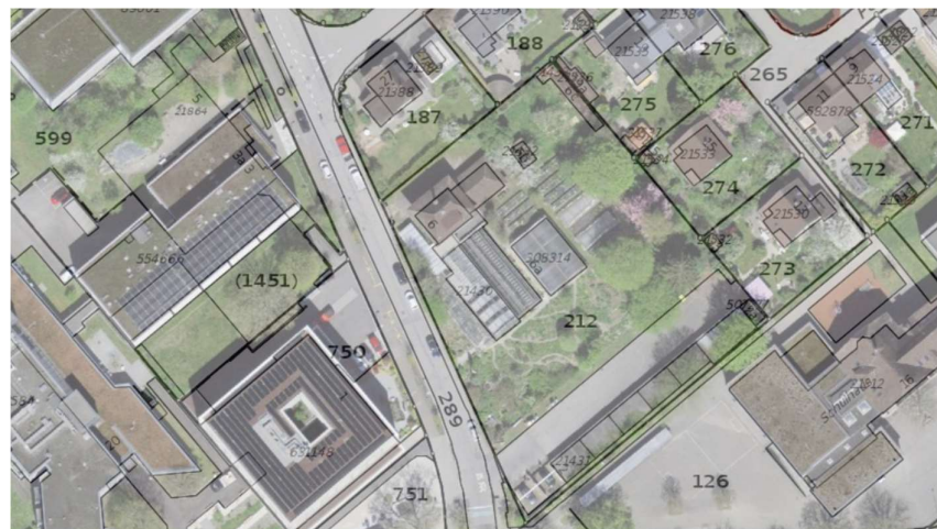
Abbildung 2 Luftbild Areal Chutzengarte mit Parzellenstruktur (massstablos)

Der vorliegende Bericht bezweckt die Erfassung und Charakterisierung des Garten- und Gehölzbestands auf den beiden Parzellen GBBL-Nr. 212 und GBBL-Nr. 187.