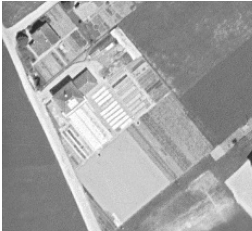
Abbildung 4 Luftbild 1938 – Die Nutzung als Gärtnerei ist deutlich sichtbar.