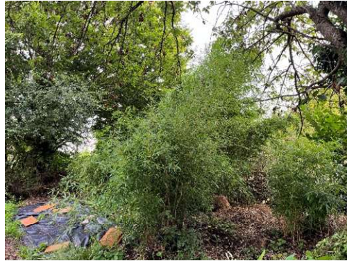
Gehölzgruppe – Gartenbereich mit grossflächigen Grüngut- und Komposthaufen sowie exotischen Gehölzen