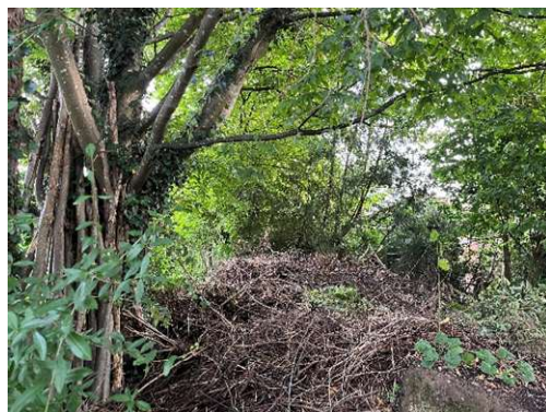
Einzelgehölze mit Kompost