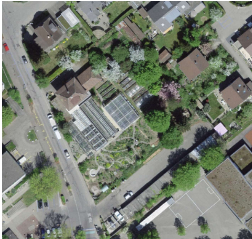
Abbildung 8 Luftbild 2018 – Heutige Situation mit Schaugarten (v.a. Stauden)