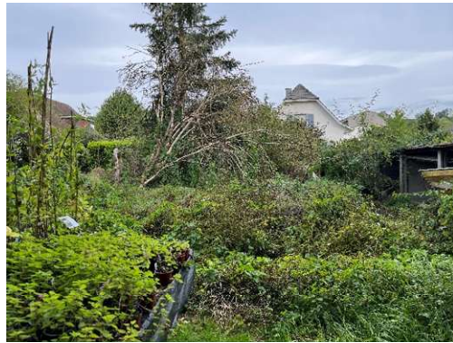
Verwucherte Gartenbereiche im Bereich des Staudengartens