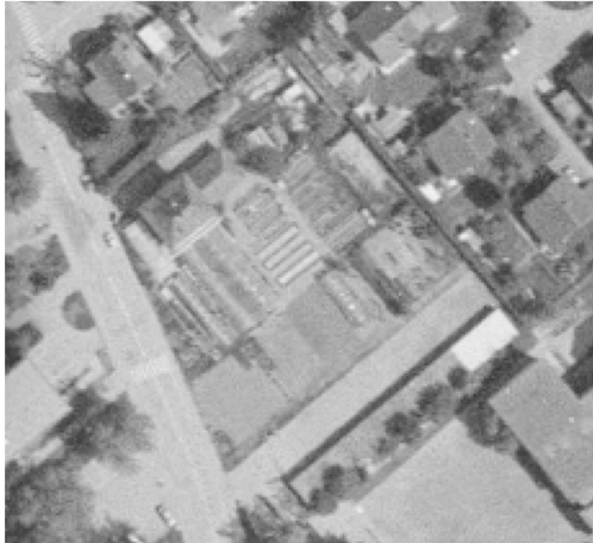
Abbildung 6 Luftbild 1987 – Die Bestockung südöstlich der Garagen ist bereits sichtbar.