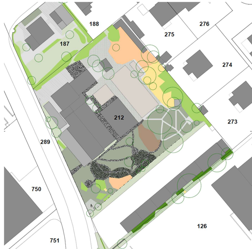
Abbildung 3 IST-Situation Parzellen GBBL-NR. 212, 187 und 126 (massstabslos, siehe Plan Beilage 1)

Die zu beurteilende Bestockung umfasst die Parzellen GBBL-Nr. 212 und GBBL-Nr. 187 sowie teilweise die Parzelle GBBL-Nr. 126 im Übergangsbereich.