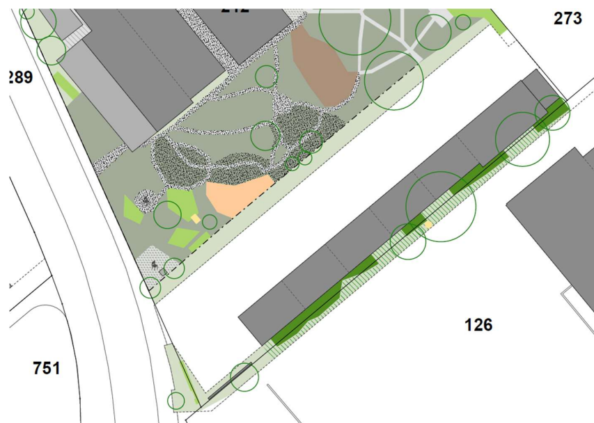
Abbildung 9 Schützenswerte Hecke entlang Garagenboxen mit Gehölzbestand (dunkelgrün) und Krautsaum (hellgrün / schraffiert)

Gestützt auf die Erkenntnisse des vorliegenden Fachberichts kann festgehalten werden, dass innerhalb des Areals «Chutzegarte» umfassend die Parzellen GBBL-Nr. 212 (Zone mit Planungspflicht ZPP) und GBBL-Nr. 187 (Wohnzone W2) eine schützenswerte Hecke im Umfang von 132.50 m 2 (inkl. Gehölzbestand und Krautsaum bestimmt wurde. Weitere geschützte Einzelgehölze, Gehölzbestände oder anderweitige Naturobjekte sind keine zu verzeichnen.