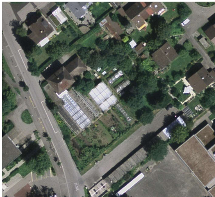
Abbildung 7 Luftbild 2007 – Die Gehölzstrukturen innerhalb der Gärtnerei sind deutlich gewachsen.