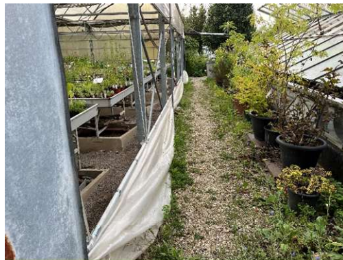
Begehbare Fläche eingekiest