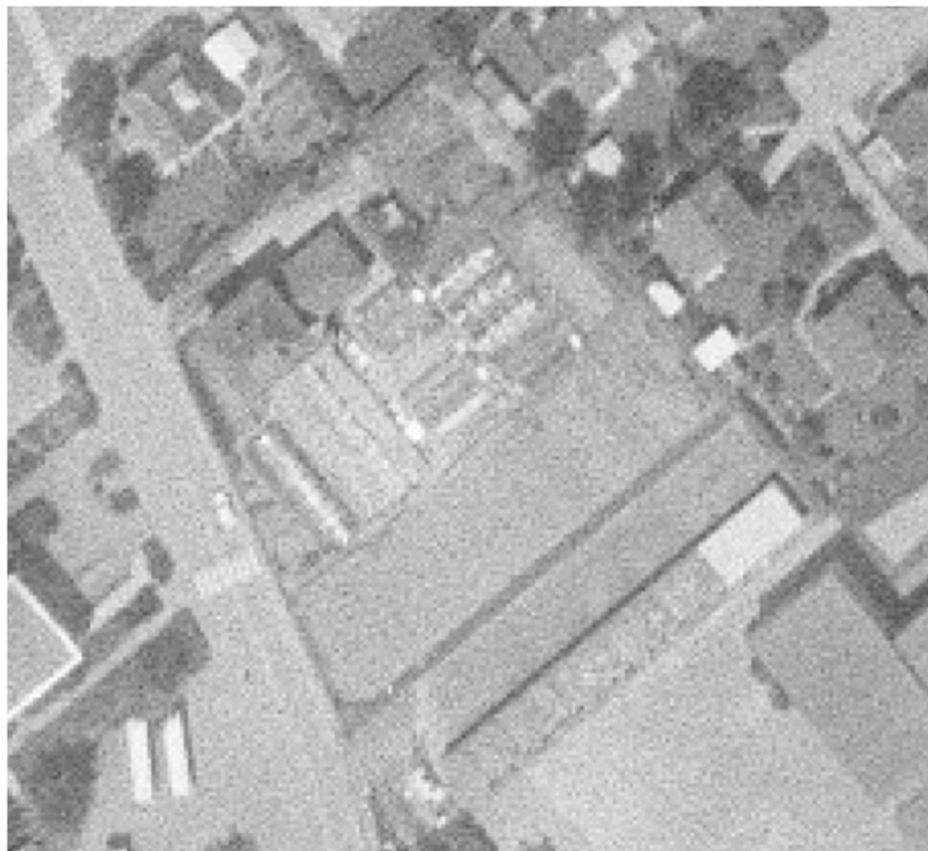
Abbildung 5 Luftbild 1975 – Der Bau der Garagen ist abgeschlossen.