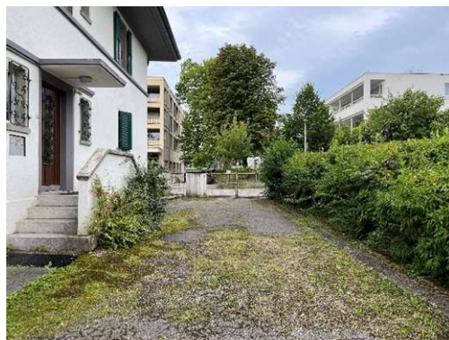
Begehbare Fläche befestigt