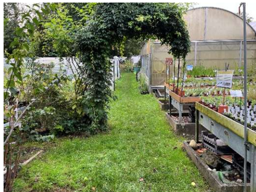
Begehbare Fläche eingewachsen / Rasen