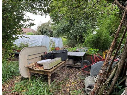
Lagerfläche auf dem Gärtnereiareal