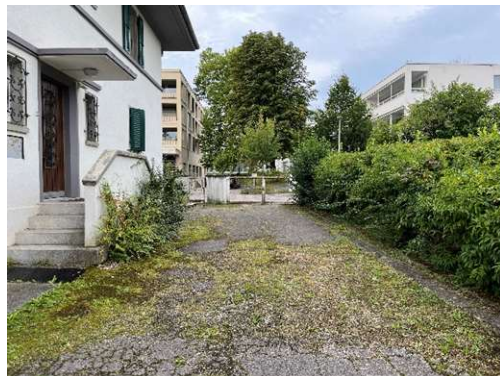
Gehölzgruppe – Formschnitthecke entlang Parzellengrenze im nördlichen Erschliessungsbereich